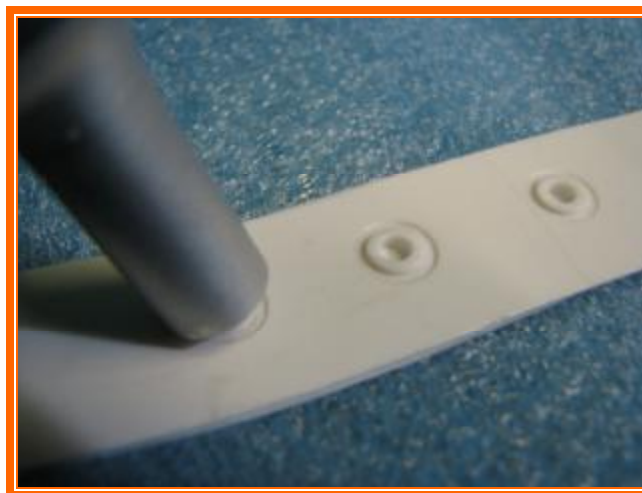
Ultrazvukové generátory meniče a nástroje .