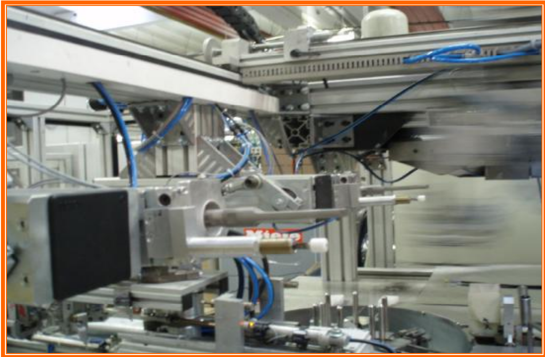
Ultrazvuková zväračka UWM 250/40kHz použitá v baličke .( MIELE )